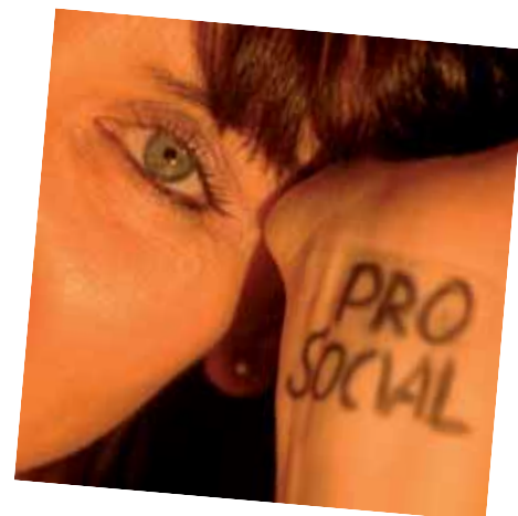
Donatella Ripamonti Grafica